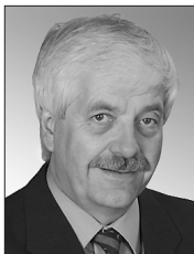
Präsident des Stiftungsrates Président du Conseil de fondation Presidente del Consiglio di fondazione

Einer der Schwerpunkte der Überprüfung war die Finanzierung der AHV-Überbrückungsrenten bei vorzeitigen Pensionierungen zwischen dem 60. und 65. Altersjahr. Die vom Arbeitgeber geleisteten Beiträge decken die jährlichen Ausgaben für diese Überbrückungsrenten in den vergangenen Jahren nur etwa zur Hälfte, da wesentlich mehr Versicherte als angenommen von den Überbrückungsrenten Gebrauch machten. Dies führt dazu, dass der Umlagefonds Jahr für Jahr Defizite ausweist, die über die Rendite gedeckt werden müssen. Der Stiftungsrat hat die Finanzierung lösen können und regelt die AHV-Überbrückungsrente per 1.1.2009 neu. Da dieses Modell finanzierbar und sozialverträglich ist, wird es auch von der Konzernleitung und den Sozialpartnern getragen. Für zahlreiche Versicherte