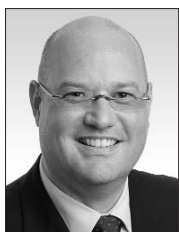
Geschäftsführer Le Directeur Il Direttore