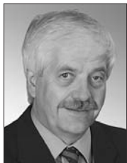
Präsident des Stiftungsrates Président du Conseil de fondation Presidente del Consiglio di fondazione

Wie können wir dies erreichen? Mit einer Mischung aus Kontinuität und stetigem Wandel. Sowohl der Stiftungsrat als auch die Geschäftsführung haben im letzten Jahr