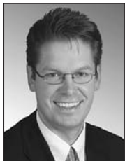
Präsident der Anlagekommission Président de la commission des placements Presidente della Commissione per gli investimenti

Anlagekommission und Stiftungsrat haben sich u. a. auch mit der Affäre um die Fusion der